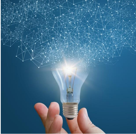
Şekil 5.1.4 İnovasyon Yönetim Akademisi Kursu

İnovasyon Yönetim Akademisi Kursu, bireysel ve kurumsal katılımcıların inovasyon kapasitesinin artırılması amacıyla Mersin Teknopark firma temsilcileri ve isteyen kişilere yönelik 15 saat süreli verilmek üzere planlanmış olup başarılı bir şekilde tamamlanmıştır.